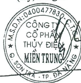
Hồ Quốc Việt